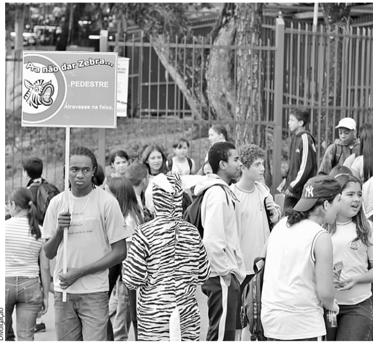
Agentes da prefeitura fazem campanha educativa na saída das escolas

A cidade oferece um total de 656 vagas para cursos diversos, com duração média de três meses. Outras 400 vagas são destinadas a bolsistas do programa Bolsa Auxílio Qualificação que já concluíram o ensino fundamental.